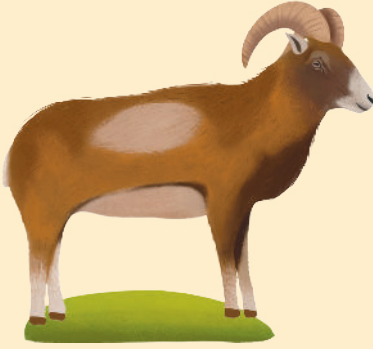
Anadolu Yaban Koyunu